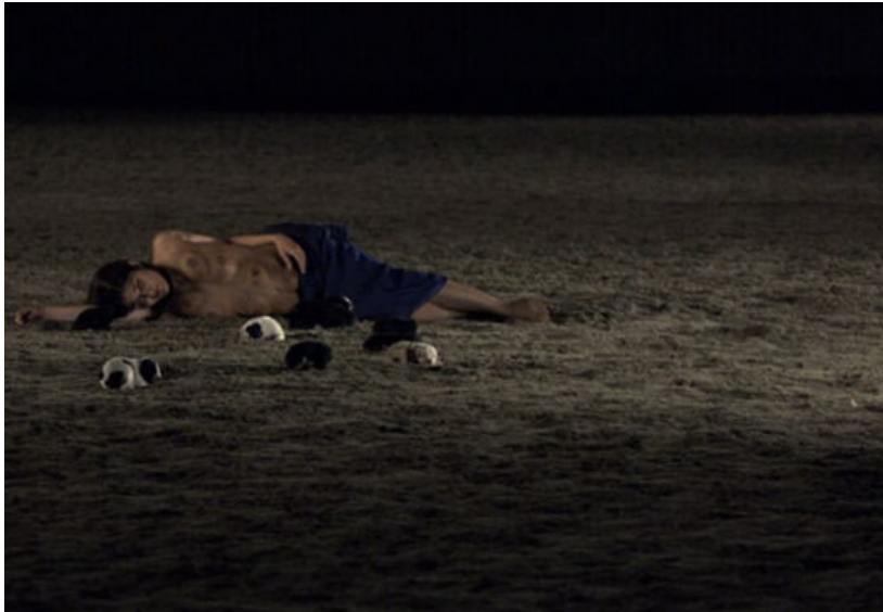
still uit Three Farewells (Janis Raza, 2013)

Van waarschuwende verhalen en oproepen tot verzet, van het presenteren van nieuwe perspectieven in co-creatie met de natuur en het waarnemen van de wereld vanuit een niet-humaan perspectief, het zijn allemaal reacties op dat fameuze milieurapport uit 1972 dat nog even actueel en urgent is als vijftig jaar geleden.