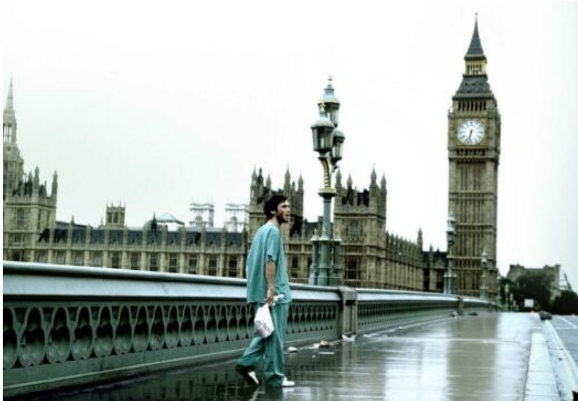
still uit 28 Days Later (Danny Boyle, GB/US 2002)