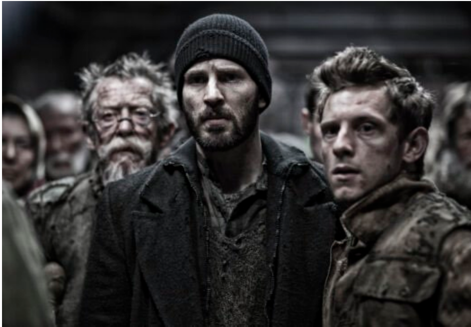
still uit Snowpiercer (Bong Joon-Ho, US 2013)