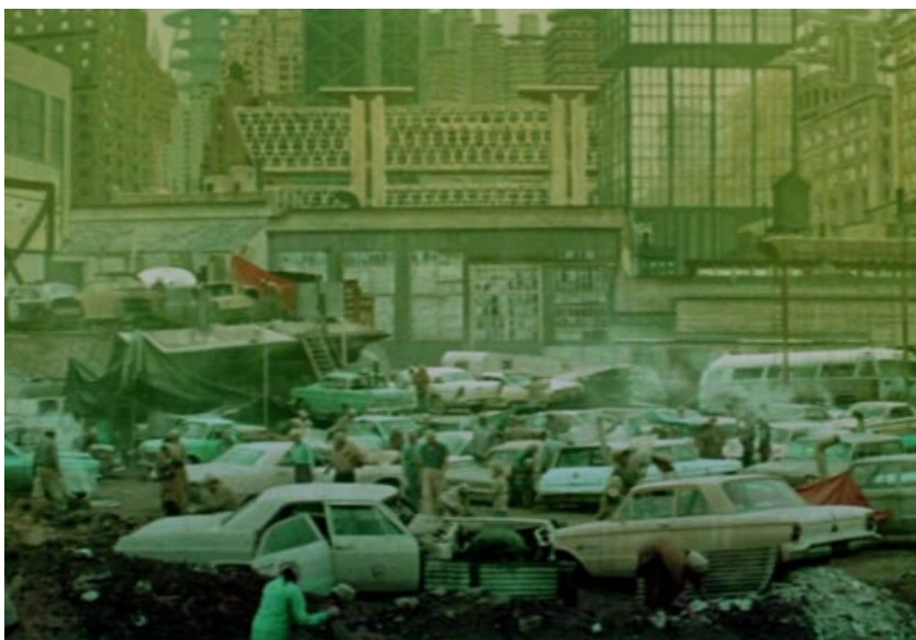
still uit Soylent Green (Richard Fleischer, US 1974)

Fictiefilms uit de jaren zeventig presenteren fantasierijke apocalyptische scenario's die mogelijke consequenties van exponentiele bevolkingsgroei en toenemende vraag naar grondstoffen en consumptiegoederen invoelbaar maken. In Soylent Green (Richard Fleischer, 1973) is de populatie van New York in 2022 geëxplodeerd, de temperatuur gestegen tot onaangename plakkerige hitte en is de aarde zo uitgeput dat van water, voedselvoorziening en woningen geen sprake meer is. Bezweet, dakloos en hongerig getuigen de personages in de film hoe van beschaving nog maar weinig overblijft wanneer er gevochten moet worden om het schaarse synthetisch geproduceerde voedsel, soylent green. In 28 Days Later (Danny Boyle, 2002) verandert een pandemie besmette mensen binnen 20 seconden in woedende zombie-achtige monsters. Enkele overblijvers leven van cola en marsrepen.