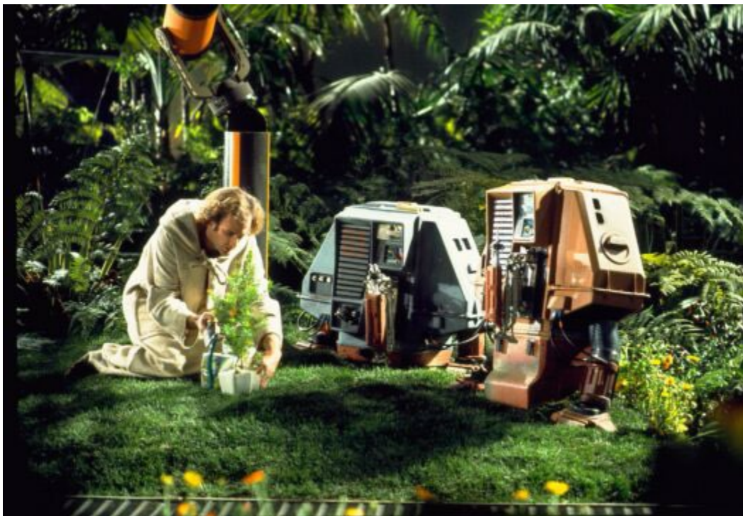
still uit Silent Running (Douglas Trumbull, US 1971)

zien is in de fascinerende documentaire Spaceship Earth (Matt Wolf, 2020) waarin de idealen van de jaren zeventig voor een evenwichtigere balans tussen natuur, mens en technologie, worden omgezet in een wetenschappelijk experiment. Acht "biospherians" worden in de jaren negentig voor twee jaar opgesloten in Biosphere 2, een groot sferisch complex waarin alle elementen van de natuur zijn opgenomen (een soort Ark van Noah, inclusief een oceaan, een savanne, allerlei soorten bomen, planten en dieren). Doel is te zien wat er nodig is om het atmosferisch evenwicht en andere omstandigheden om te overleven te behouden. Het project faalt omdat op artificiële wijze hoge concentraties CO 2 moeten worden weggehaald en extra zuurstof naar binnen moet gepompt. Maar juist dat falen geeft te denken over onze eigen planeet, Biosphere 1, waarbij het moeilijker is om de atmosfeer op die kunstmatige manier op peil te houden.