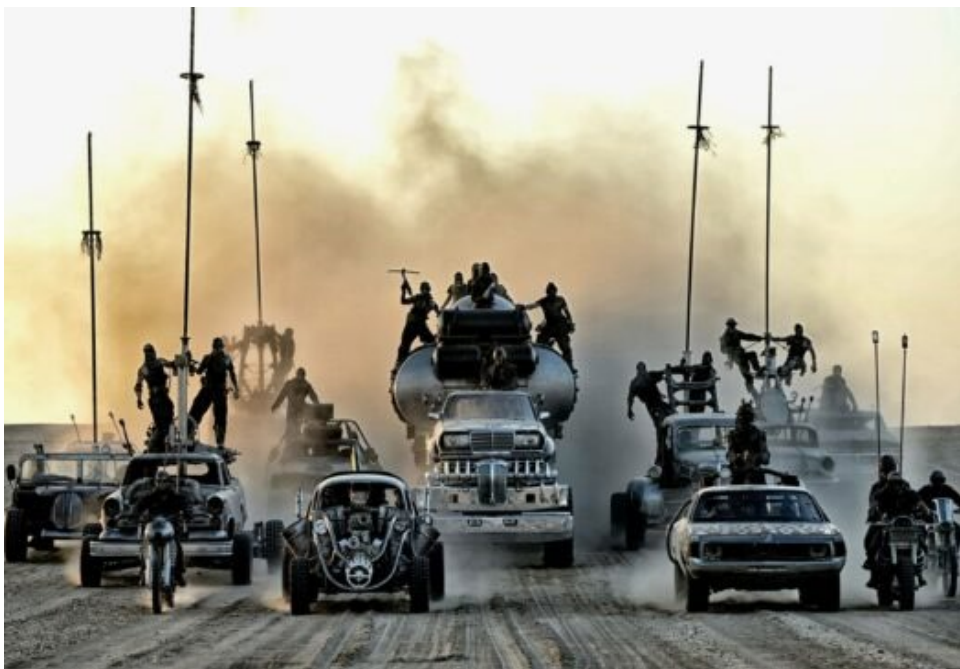
still uit Mad Max: Fury Road (George Miller, US/AU 2015)

Naast pessimisme ('het is al te laat' als in Soylent Green ), en activisme (rebellie en verzet om tot nieuwe verhoudingen te komen in post-apocalyptische verhalen), zijn er ook films die laten zien dat we veel beter voor de aarde moeten zorgen, in samenwerking en co-creatie met de natuur. In Silent Running (Douglas Trumbull, 1972) worden de laatste planten en bomen verzorgd door een kosmonaut en een paar robots in een biosphere die gekoppeld is aan een ruimtestation. Het fantasievolle scenario is in de jaren negentig omgezet in werkelijkheid zoals te