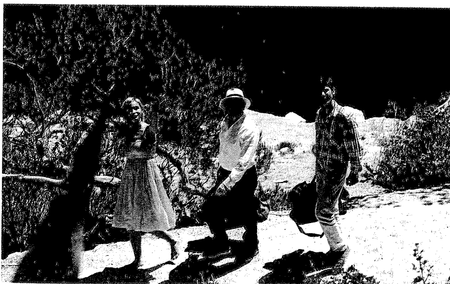
Sarah (Emmanuelle Béart), Adrien (Michel Blanc) en Manu (Johan Libéreau)

'Les Témoins' is nu te zien in de Nederlandse bioscopen